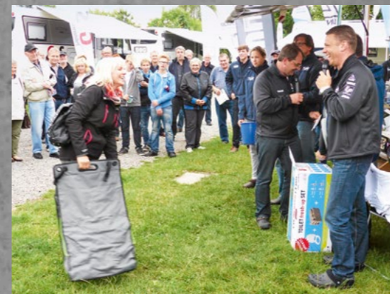
Große Freude macht allen Beteiligten die allabendliche Tombola mit tollen Gewinnen.