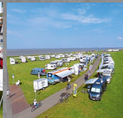
Das Team der Technik-Caravane – siehe Bild oben – war 2016 zu Gast an der Nordsee.