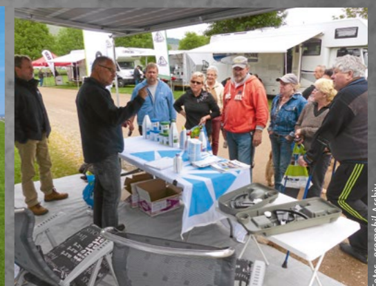
Beratung steht bei Deutschlands größter mobiler Info-Messe an erster Stelle – und wird rege angenommen.